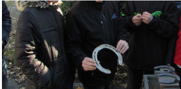
Visite chez le forgeron

Notre site - https://cognin.ent.auvergnerhonealpes.fr