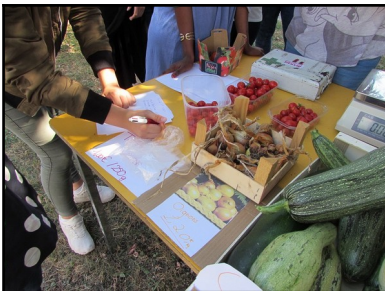
TP vente des légumes du jardin pédagogique