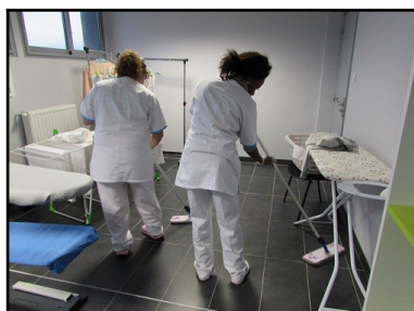
TP lavage humide

A la sortie de 3 ème de collège, SEGPA (Section d'Enseignement Général et professionnel Adapté), EA (Enseignement Agricole). Affectation affelnet, dossier à remplir dans le collège d'origine.