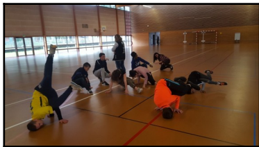
Activités culturelles et/ou sportives. Hip Hop