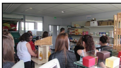
TP au magasin de vente