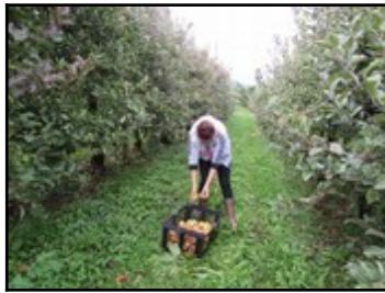
Cueillette de pommes