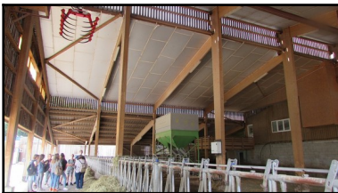
Découverte des métiers liés à l'agriculture

Réaliser un mini-stage dans l'établissement est vivement conseillé en mars, avril.